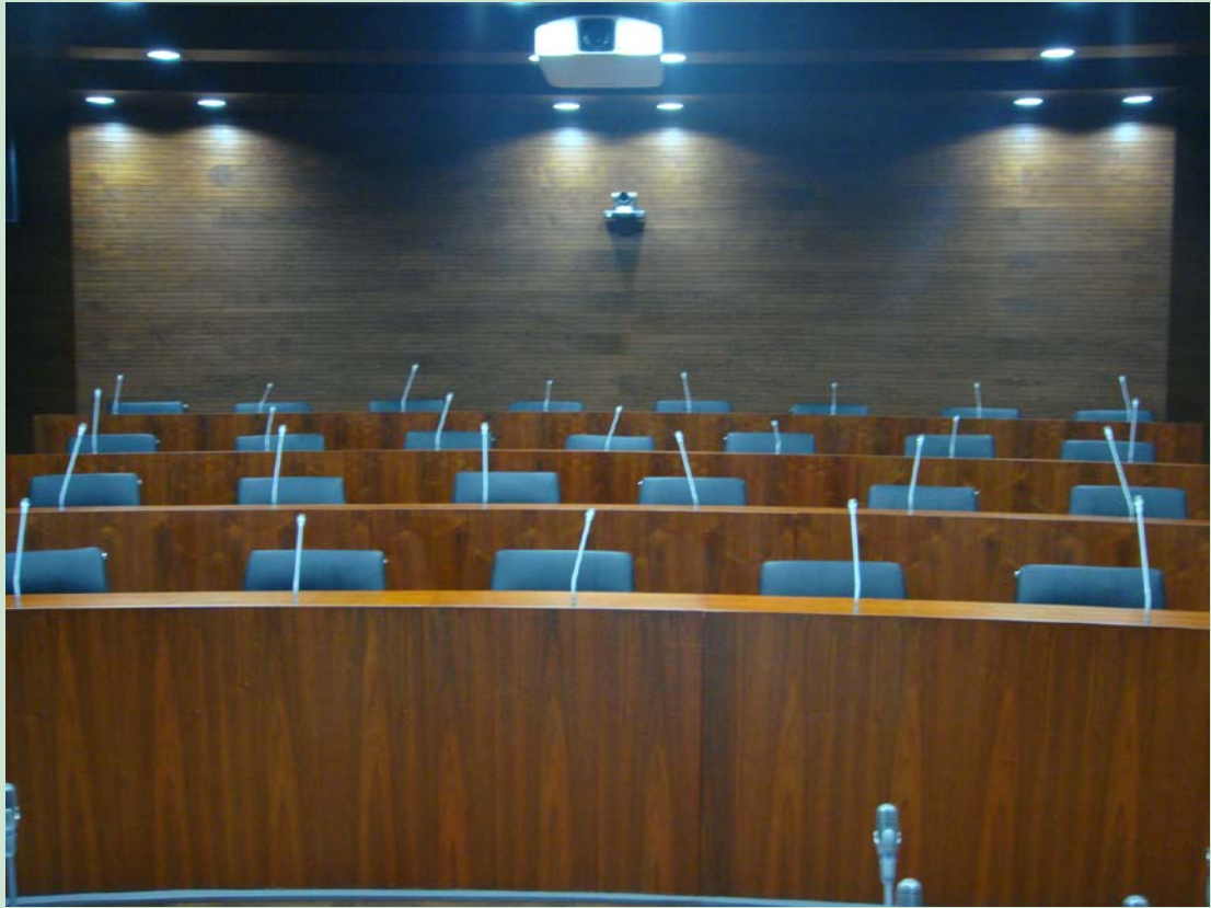
京师学堂第一会议室现场图