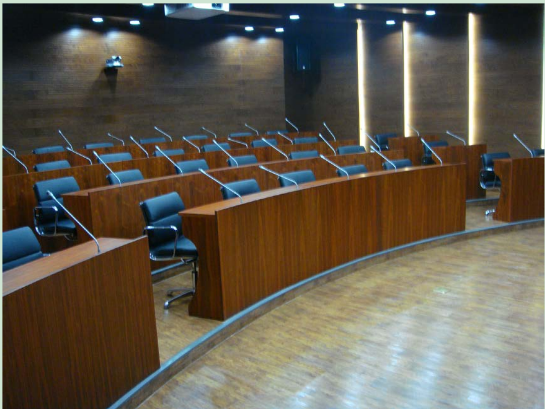
京师学堂第一会议室现场图