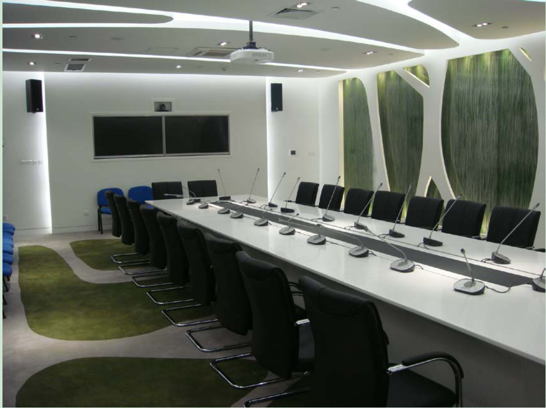
京师学堂第二会议室现场图