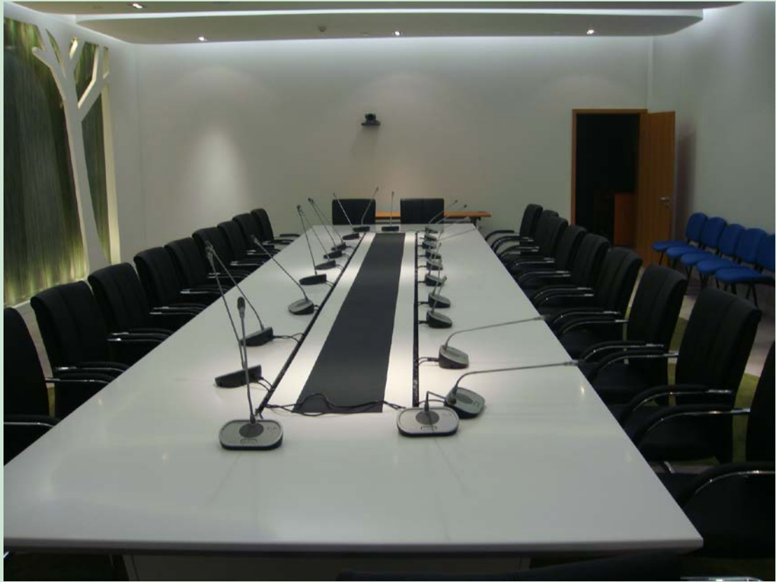
京师学堂第二会议室现场图