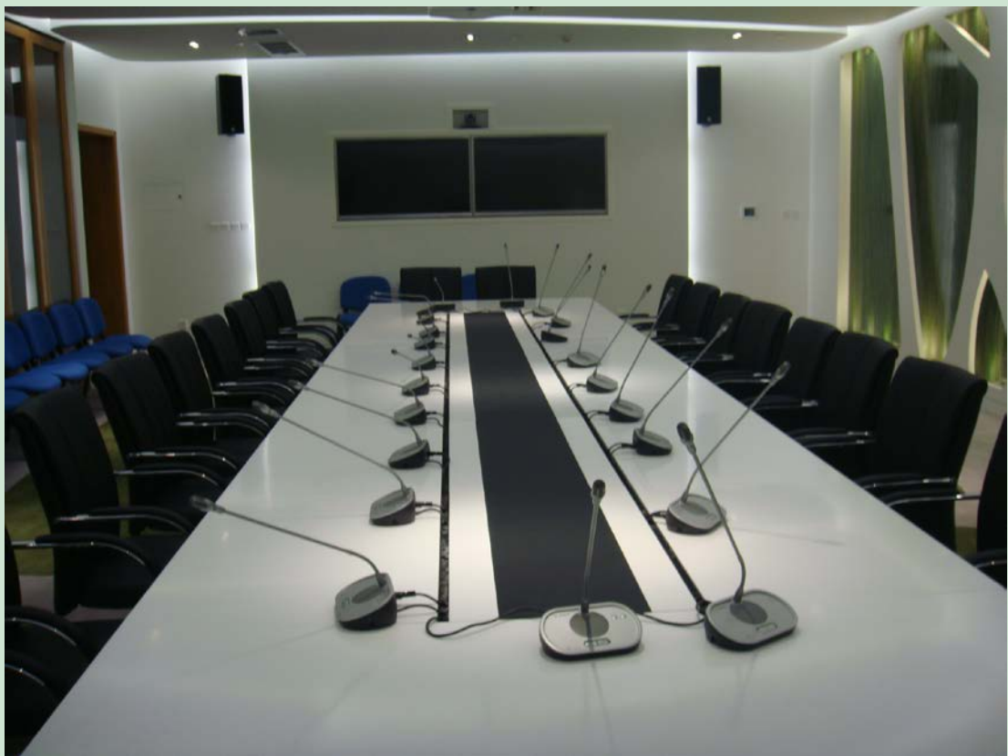
京师学堂第二会议室现场图