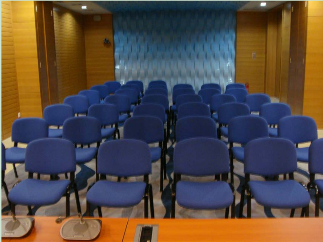
京师学堂第三会议室现场图