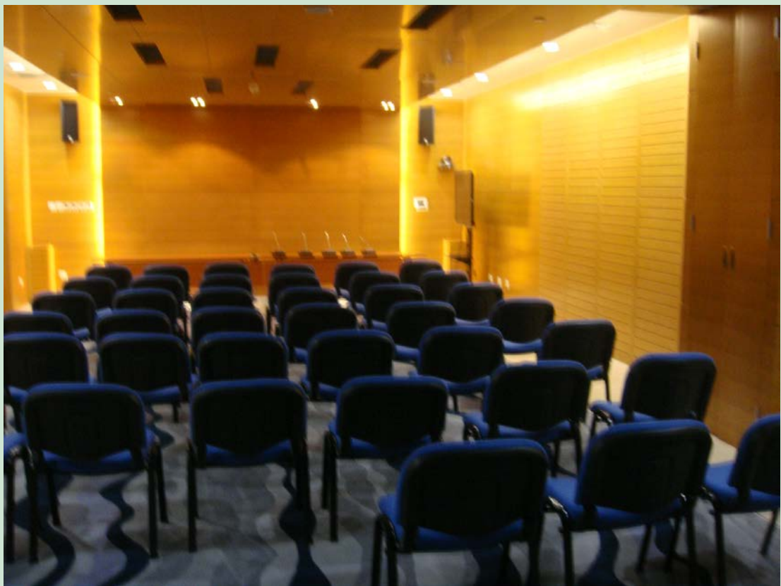
京师学堂第三会议室现场图