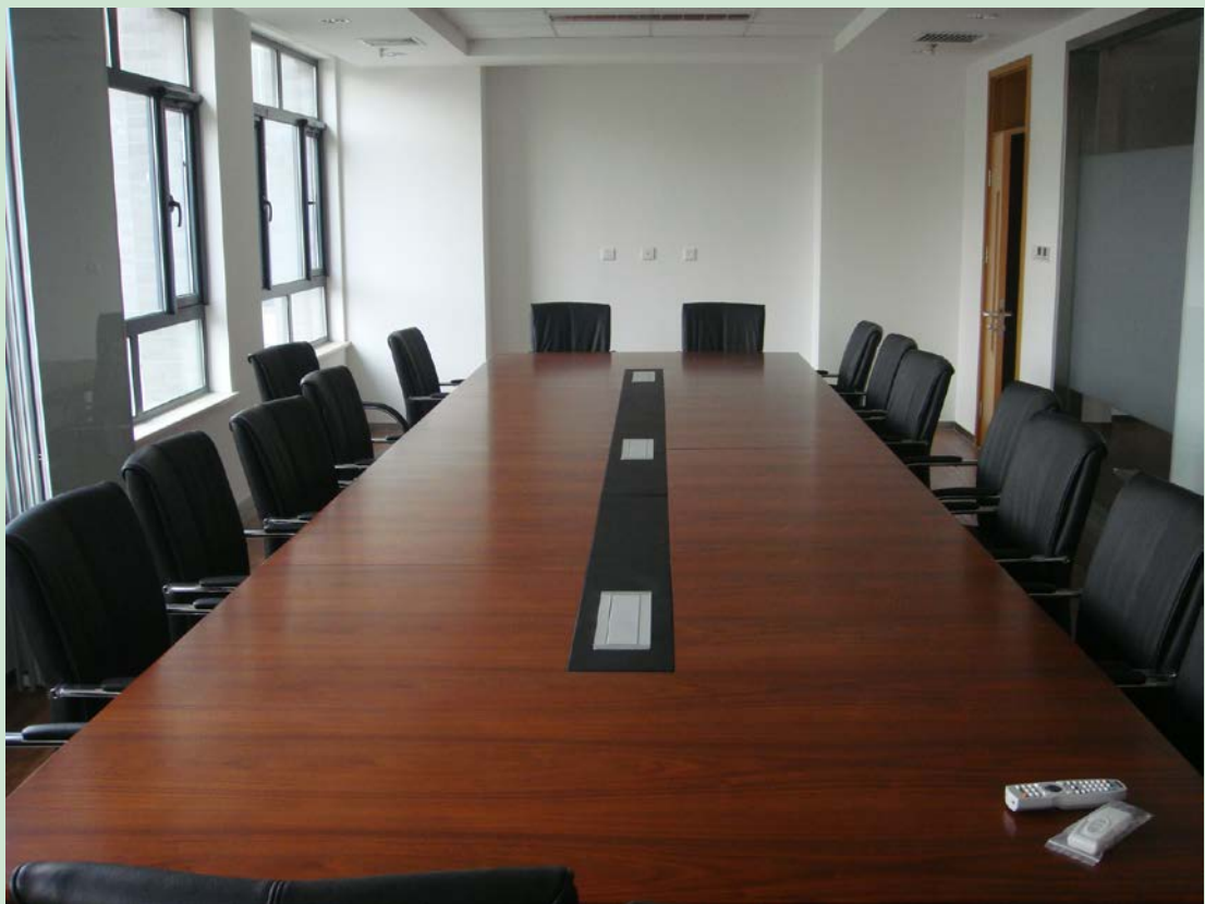
京师学堂第四会议室现场图