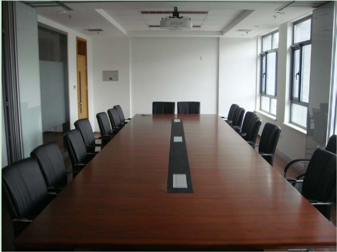
京师学堂第四会议室现场图