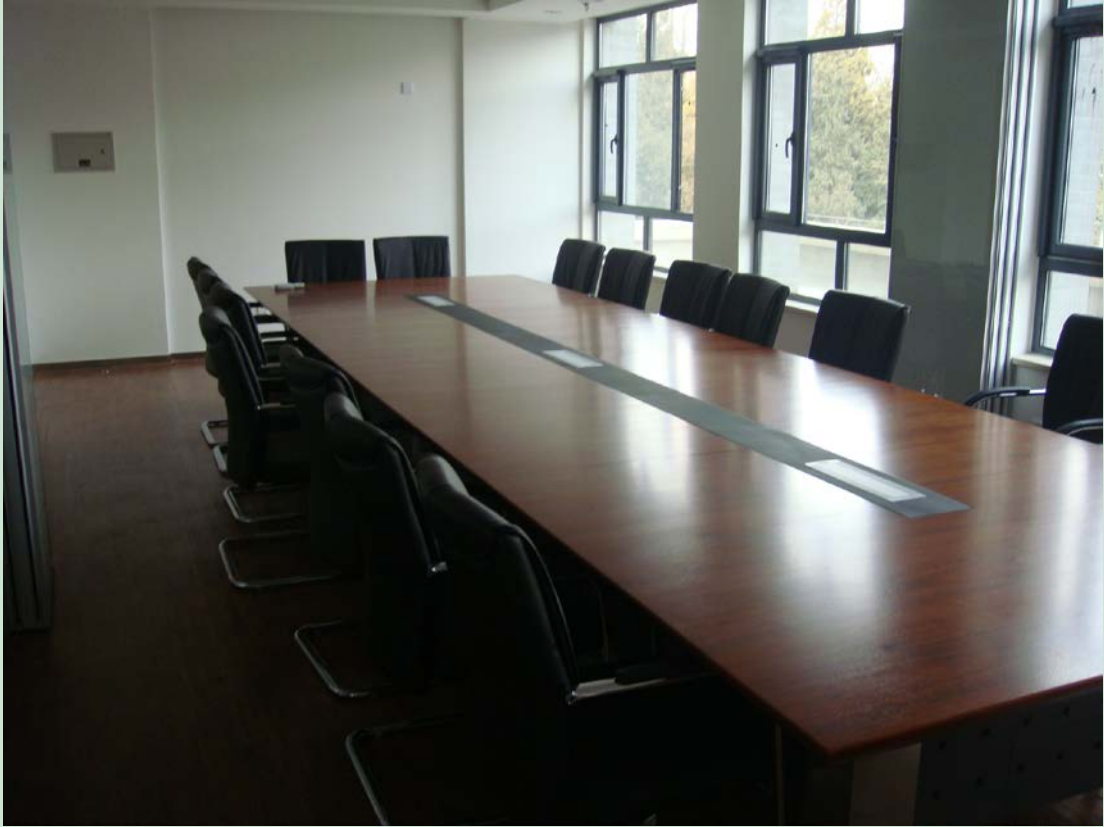
京师学堂第四会议室现场图