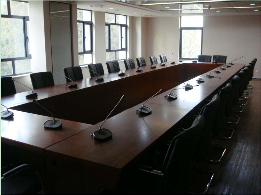
京师学堂第五会议室现场图