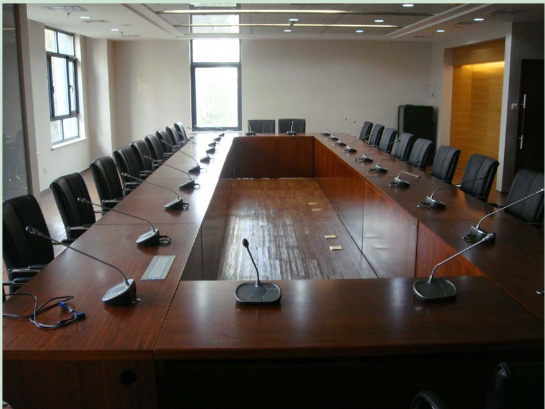
京师学堂第五会议室现场图