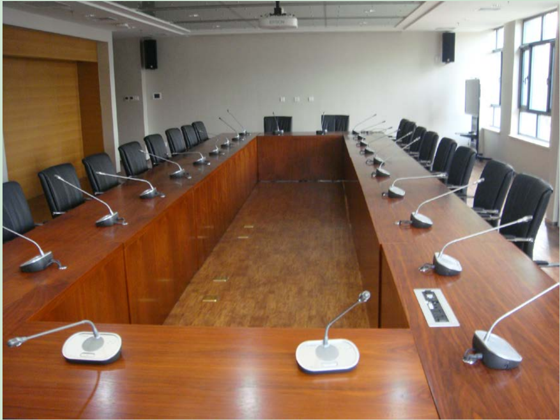
京师学堂第五会议室现场图