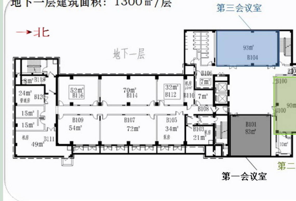
京师学堂地下一层平面图